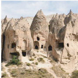
カッパドキア／トルコ