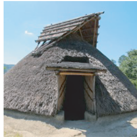
竪穴式住居／日本・岡山県